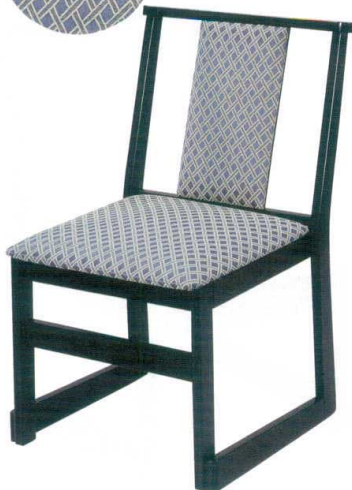
3-867-01 1700290 【木】青山高座椅子 グリーン(布) SH430 ¥23,000 W470×D590×H780/SH430 重量約6.2kg 梱3