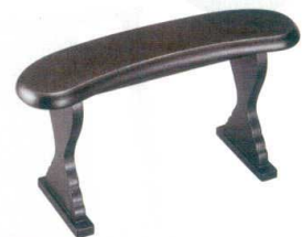
3-867-08 1700297 【木】脇息 黒乾漆 ¥28,000 550×130×H280