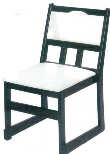
3-867-03 1700292 【木】祇園高座椅子 アイボリー(レザー) SH430 ¥24,000 W470×D540×H780/SH430 重量約6.0kg 梱3