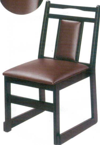
3-867-04 1700293 【木】富士高座椅子 ブラウン(レザー) SH430 ¥24,000 W430×D550×H780/SH430 重量約5.8kg 梱3