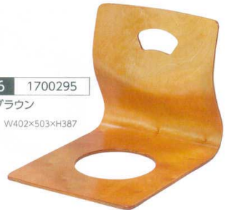
3-867-06 1700295 【木】座椅子 ブラウン ¥12,000 W402×503×H387