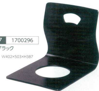
3-867-07 1700296 【木】座椅子 ブラック ¥12,000 W402×503×H387