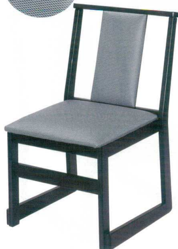
3-867-02 1700291 【木】青山高座椅子 グレー(レザー) SH430 ¥23,000 W470×D590×H780/SH430 重量約6.2kg 梱3