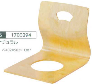
3-867-05 1700294 【木】座椅子 ナチュラル ¥12,000 W402×503×H387