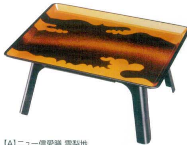
[A]ニュー信愛膳 雲梨地