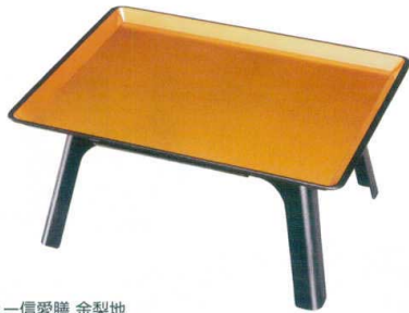
[A]ニュー信愛膳 金梨地