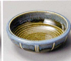
11112-010 南蛮測流し5.5深鉢 850円 (170×55mm)