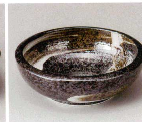
11120-280 明世荒刷毛くくり手5.5鉢 750円 (170×55mm)