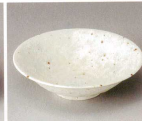
11116-080 白いらぼ5.5平鉢 800円 (180×50mm)