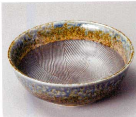
11101-240 民芸藍流し5.5中鉢 900円 (166×58mm)