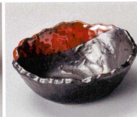
11111-350 赤掛分小鉢 850円 (155×140×55mm)