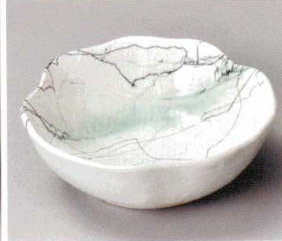
11103-280 遊線(白)マス入4.8鉢 990円 (155×150×55mm)