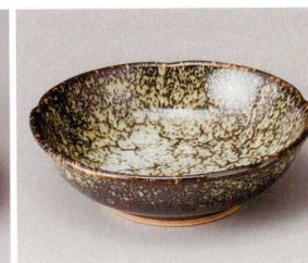
11119-150 雲海黒梅形4.5鉢 770円 (136×40mm)