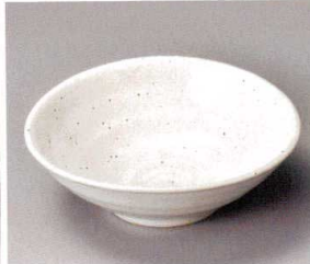
11102-240 たわみ粉引6寸鉢 900円 (180×170×57mm)