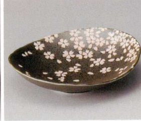
11104-120 染付桜椿円皿(大) 880円 (175×152×40mm)