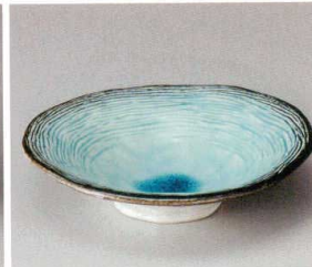
11107-270 均窯スカイ5.0平鉢 850円 (168×40mm)