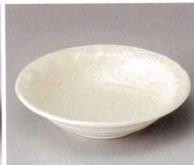
11106-230 白伊賀石目5.0鉢 850円 (166×42mm)