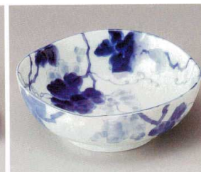
11115-010 藍染ぶどう5.5三角鉢 800円 (167×62mm)