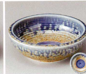
11121-280 藍流し青炎くくり手5.5鉢 750円 (170×55mm)