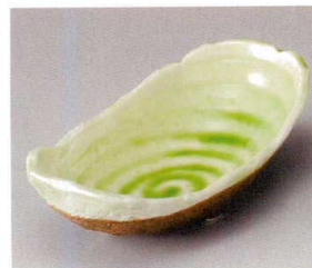
11109-300 ヒワ寒入舟小付 450円 (130×70×35mm) 11110-300 ヒワ寒入舟盛鉢 850円 (195×85×55mm)