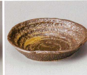
11117-180 伊賀釉5.0浅鉢 800円 (152×32mm)