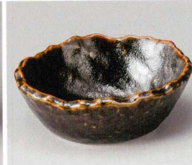
11108-350 柚子天目5.0号鉢 850円 (160×140×55mm)