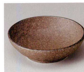
11118-050 アース5.0ボール 780円 (165×50mm)