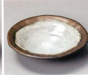
11113-180 窯変金彩5.5浅鉢 840円 (170×40mm)