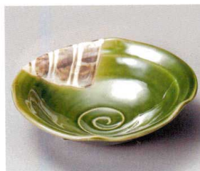
11105-150 織部織三ツ足5.0鉢 870円 (153×45mm)