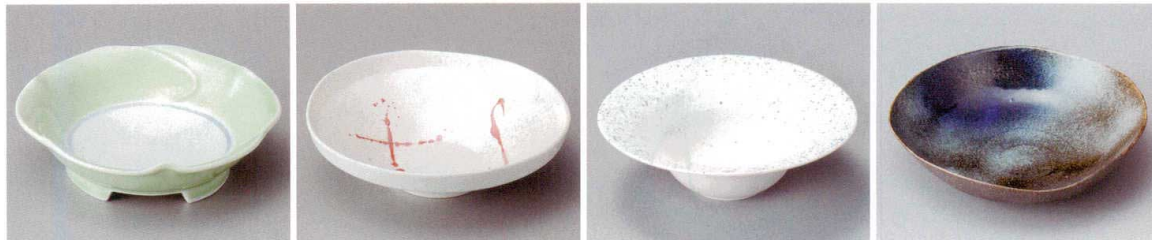
09901-180 若草多菜鉢 2,050円 (150×43mm)