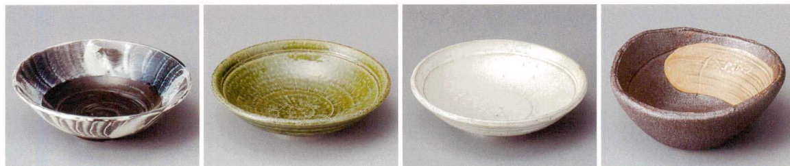
09910-280 青吹白たたき5.0向付 2,000円 (155×45mm)