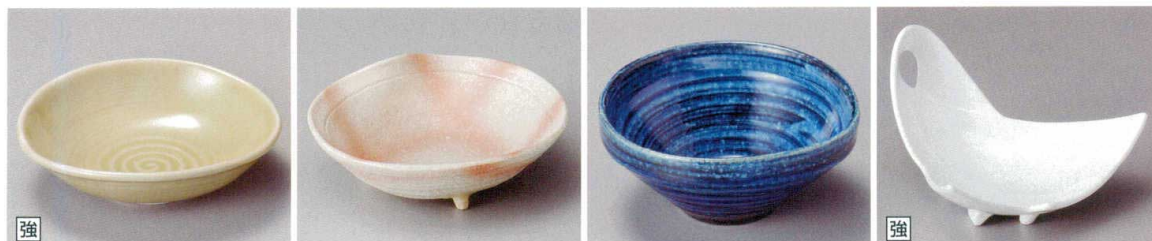
09918-230 ヒワ釉楕円中鉢 2,000円 (157×148×45mm)