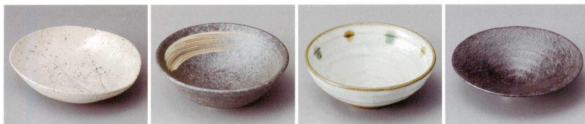
09914-220 オアシス平鉢 2,000円 (182×52mm)