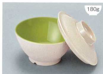
MB-897 CS(クリームストーン)ライスボール蓋 128 × 36 ¥650 MB-896 CSUG(クリームストーン内緑)ライスボール(スリム) AB 122 × 65 ①93 ・ 400ml ¥950 POINT ①内側コーティングなので、ご飯がこびりつきにくい飯椀です。 ②ご飯の白さが引き立つカラー。