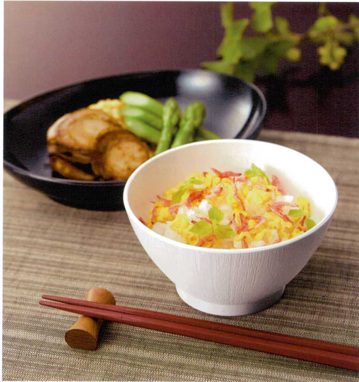
使用食器 | MB-896 W ライスボール(スリム)、MS-848 BK オーバル皿、TH-220S R PBT蓋

①：身と蓋を組み合わせた時の高さ表示です。②：ご飯を盛り付けた時の目安容量(g)です。炊き方や盛り付け方により差が出ますので現物でご確認ください。