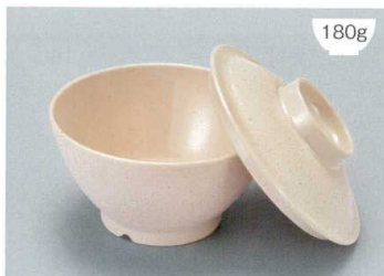
MB-897 CS(クリームストーン)ライスボール蓋 128 × 36 ¥650 ▲MB-896 CS(クリームストーン)ライスボール(スリム) AB 122 × 65 ①93 ・ 400ml ¥930 POINT 内側コーティングなので、ご飯がこびりつきにくい飯椀です。