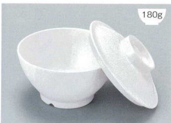
MB-897 W(ホワイト)ライスボール蓋 128 × 36 ¥650 MB-896 W(ホワイト)ライスボール(スリム) AB 122 × 65 ①93 ・ 400ml ¥930 POINT 内側コーティングなので、ご飯がこびりつきにくい飯椀です。