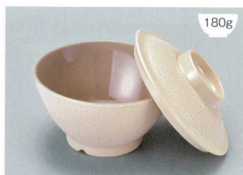
MB-897 CS(クリームストーン)ライスボール蓋 128 × 36 ¥650 MB-896 CSUK(クリームストーン内黒)ライスボール(スリム) AB 122 × 65 ①93 ・ 400ml ¥950 POINT ①内側コーティングなので、ご飯がこびりつきにくい飯椀です。 ②ご飯の白さが引き立つカラー。