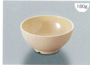
▲MB-894 CS(クリームストーン)ライスボール(レギュラー) AB 124 × 61 ・ 400ml ¥930 POINT 内側コーティングなので、ご飯がこびりつきにくい飯椀です。