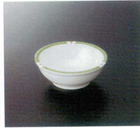
G-267BNG 丸小鉢(副食用) TC 116×43 230cc ¥770 ☎ P-301NI ¥350 T 65 冊 212頁