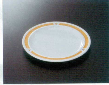
SF-73BNY 19cmライス皿(主食用) TC 192×17 ¥860 ☎ 295-OP ¥400 T 50 冊 212頁