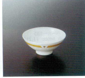
DP-104BNY 飯碗(主食用) TC 113×49 200cc ¥540