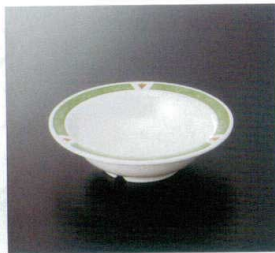
M-2BNG サラダボール(副食用) TC 150×41 250cc ¥810 ☎ P-300NI ¥350 T 68 冊 212頁