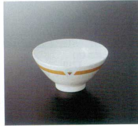
G-136BNY 飯茶碗(身)(主食用) TC 123×61 330cc ¥560