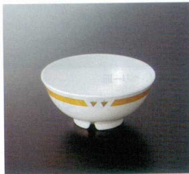
M-114BNY 飯碗(身)(主食用) TC 136×60 430cc ¥850