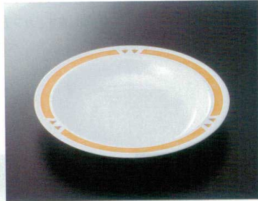
SF-101BNY 23cmスープ皿(主食用) TC 231×35 510cc ¥1,180