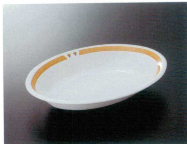
MT-196BNY ベーカー(主食用) TC 265×190×46 900cc ¥1,640