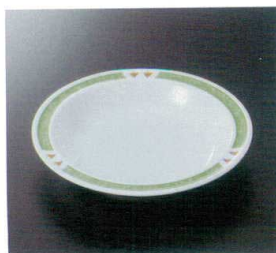
SF-51BNG 菜皿(副食用) TC 180×32 330cc ¥710 ☎ 296-OP ¥370 T 72 冊 212頁