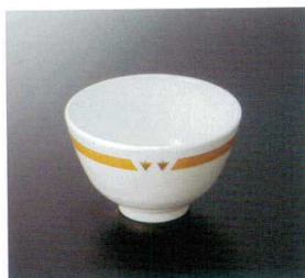
GW-552BNY 種丼(身)(主食用) TC 133×83 600cc ¥1,110

HB マークは、環境に配慮したハイブリッドメラミンです。詳しくは337頁をご覧ください。