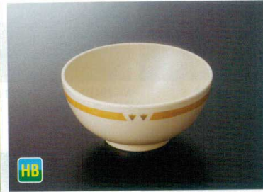
GW-554BNY 麺丼(主食用) TC 175×84 1150cc ¥1,570 ☎ 302-OP ¥390 T 98 冊 212頁