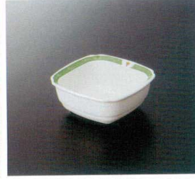
AI-151BNG 角小鉢(身)(副食用) TC 105×105×41 170cc ¥930