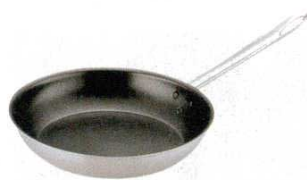
② トリノ フライパン(内面フッ素加工) (AHL-U0)