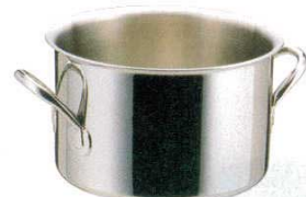
⑥ エオリア 半寸胴鍋 (AHV-48)

特長 1.熱伝導・熱保温が非常に良い材質(多層構造)を使用しておりますので、料理時間が短縮できます。 2.軽量で耐食性は抜群です。 3.電磁調理器対応。