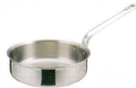
⑨ エオリア 片手浅型鍋 (AST-63)