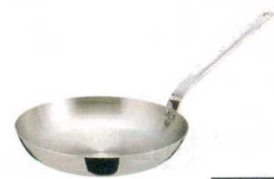
⑩ エオリア フライパン (AHL-95)