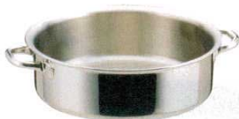
⑦ エオリア 外輪鍋 (AST-61)