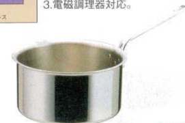
⑧ エオリア 片手深型鍋 (AST-62)