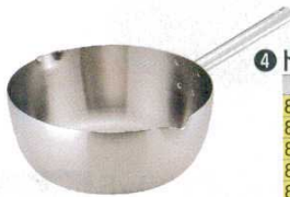
④ トリノ 雪平鍋 (AYK-65)