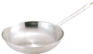
① トリノ フライパン (AHL-T9)