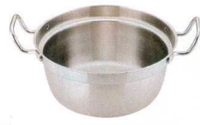
③ トリノ 和鍋 (AWN-02)