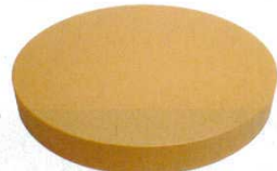
⑦ ニュー抗菌 中華まな板 (AMN-L4) 目

●底に色付 ※厚さ103mmは8回(10mmごと)、153mmは13回がせれます。