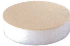
⑤ 積層 プラスチックカラー中華まな板 ベージュ (AMN-A6) 目

●底に色付 ※厚さ103mmは8回(10mmごと)、153mmは13回がせれます。