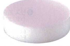
⑥ 積層 プラスチックカラー中華まな板 ピンク (AMN-A4) 目

●底に色付 ※厚さ103mmは8回(10mmごと)、153mmは13回がせれます。