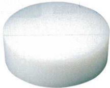
① 住友 プラスチック中華まな板 (AMN-31) 目