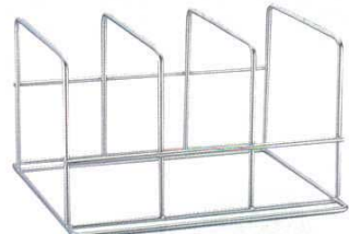
⑨ 18-8 中華まな板立 TT-3 (AMN-94) 8-0360-0901 ¥25,000 517×453×H310 適応サイズ:φ400~φ500 厚さ150まで ●中華まな板が3枚まで立てられます。