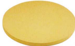
⑧ ゴム 中華まな板 (AMN-36) 目 8-0360-0801 ¥29,900 φ450×H30 質量:5.7kg