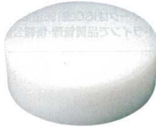
② K型 プラスチック中華まな板 (AMN-32) 目