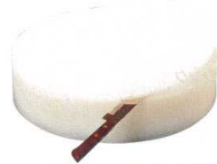
③ 積層 プラスチック中華まな板 (AMN-33) 目