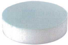
④ 積層 プラスチックカラー中華まな板 ブルー (AMN-A5) 目