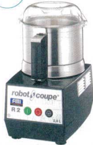
1 ロボクーブ R-2A (CLB-01) 8-0614-0101 ¥181,000 210×285×H370 1スピード