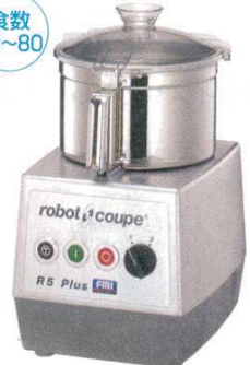
4 ロボクーブ R-5Plus 200V (CLB-03) 8-0614-0401 ¥482,000 280×320×H480 2スピード