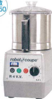
3 ロボクーブ R-4V.V.B (CLB-30) 8-0614-0301 ¥398,000 225×305×H470 無段階変速