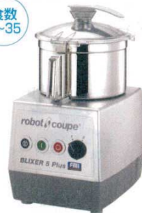
6 ロボクーブ ブレンダー 5Plus (CLB-08) 8-0614-0601 ¥509,000 280×320×H495 2スピード 低速と高速