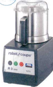
2 ロボクーブ R-3D (CLB-24) 8-0614-0201 ¥244,000 220×305×H430 1スピード