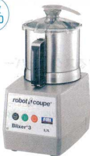
5 ロボクーブ ブレンダー 3D (CLB-23) 8-0614-0501 ¥305,000 225×305×H450 1スピード 高速