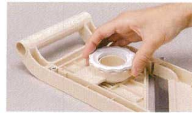
厚さ調節ダイヤル