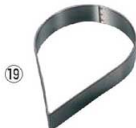
⑲ティアドロップ型