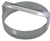
① 18-10 手付 丸ギザ 抜型