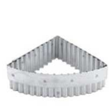
⑰ マトファー サブレギザ 抜型 79891