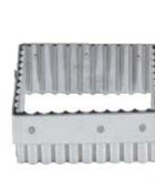
⑯ マトファー 角ギザ 抜型 79652