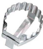
⑬ マトファー コキール 抜型 79893