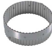
② 18-10 手無 丸ギザ 抜型