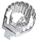
⑭ マトファー コキール 抜型 79894