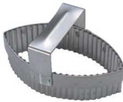
③ 18-10 手付 木の葉ギザ 抜型