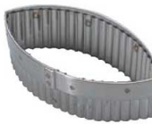
④ 18-10 手無 木の葉ギザ 抜型