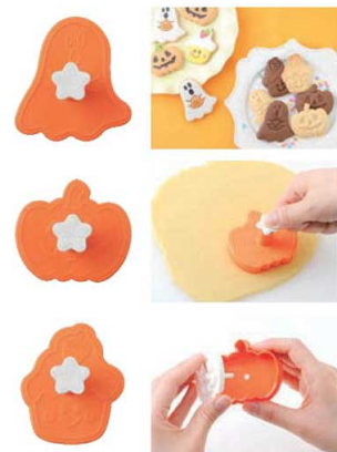
⑲クッキー抜き型 お菓子なHappyHalloween! (3個組)