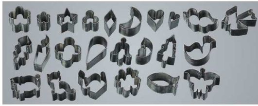
①マトファー 抜型 24pcsセット 79628