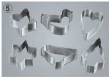
⑤18-8 クッキー抜型 6pcsセット