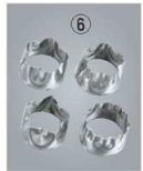
⑥18-8 ビスケット 抜型