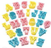
①PCクッキー抜型 アルファベット26pcs No.1733