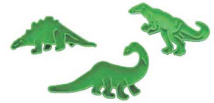
⑤恐竜クッキー抜型3P No.1308