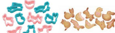
④PCクッキー抜型 動物 10pcs No.752