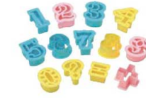
②PCクッキー抜型フィガ(数字) 13pcs No.1734