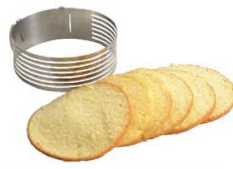
⑥18-8 ケーキスライサー No.1726