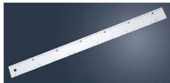
⑫テルモハウザー ドゥルラーソフトタイプ 44051