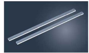
③アクリル ケーキカッター (2本1組)