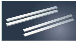
②アルミ ケーキカッター (2本1組)

●パウル棒をスポンジの両サイドに置き、ナイフを滑らせるようにカットします。色々な厚みのケーキを切る事ができます。