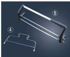
④ケーキスライサー No.1311