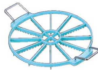
⑩PC スポンジ マーカー