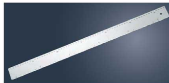
⑬テルモハウザー ドゥルラーハードタイプ 44061