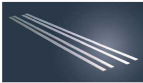
①EBM 18-8 パウル棒 (2本1組)