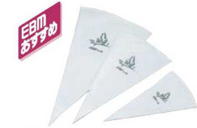
①EBM プロフェッショナル 絞り袋