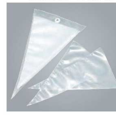
⑫せき ポリエチレン絞り袋 (50枚入)