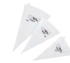
⑤テルモハウザー ウльтра ベストリーバッグ