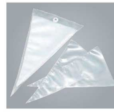
⑬せき ポリエチレン プレミアム絞り袋 (50枚入)

材質:ポリエチレン 耐熱温度:80℃ 耐冷温度:-10℃ ●必要時に一枚ずつ取り出せる便利な取り出し口が付いています。 ●必要時に一枚ずつ取り出せる便利な取り出し口が付いています。