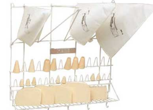
⑩テルモハウザー コーティング バッグドライヤー 44021

外寸:500×350×H480 ●絞り袋と口金を干して乾燥させます。 ラック部分は小物置きになります。 ※絞り袋、口金は別売です。