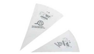
③テルモハウザー シルバーベストリーバッグ

材質:ポリウレタン 耐熱温度:260℃ ●内側はノンスティック、外側はすべりにくい加工になっています。 ●柔軟性があり、しぼりやすくなっています。