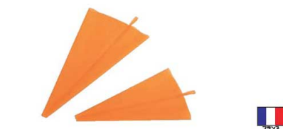
②デバイヤー ポリウレタンベストリーバッグ