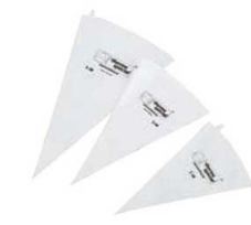
④テルモハウザー スペシャル ベストリーバッグ