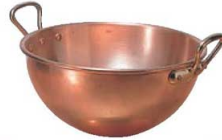
② ムヴィエール 銅 ボール 耳付