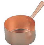
⑨ ムヴィエール 銅ポエロン (スズメッキ無)