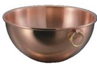
① ムヴィエール 銅 ボール

銅鍋 (長所) 熱伝導率が良いので弱火で使い、温度調節がしやすく、抗菌作用もあります。鍋に使われる材質の中で最も高い熱伝導を誇ります。