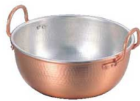
④ 銅 さわり鍋