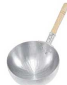
⑭ ナカオ アルミ 打出片手 ポーズ鍋