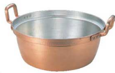
⑤ EBM 銅 段付鍋 錫引きあり