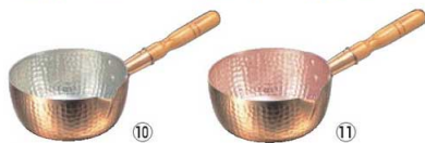
⑩ 銅 片口雪平鍋 (内面錫引)