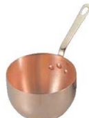
⑧ ムヴィエール 銅 サバイオンボール 2195-16