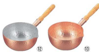
⑫ 銅 打出 片口坊主鍋 (内面錫引有)