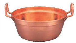
⑥ EBM 銅 段付鍋 錫引きなし