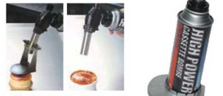
③キャラメライザー SCT-530CZ

サイズ:320×100×H225 カートリッジガスボンベCT-200 1-1046-0202 7368600 ¥1,200 燃焼時間:約120分