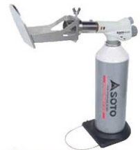
④キャラメライザー KC-810CL

●コテは60秒加熱後に使用可能(600℃)となります。 ●コテを外してガスーチとしても使用できます。 ●逆さ使用できます。