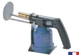
②デバイヤーキャラメライザー 3052-15

サイズ:φ115×430 単相 110V/800W ※故障の原因となりますので連続して20分以上ご使用にならないでください。