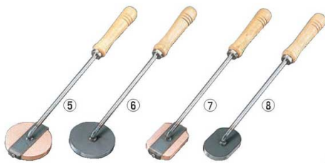
⑤銅木柄丸キャラメライザー 8cm

Check! ●キャラメライザー・焼ごては、ケーキの上にふりかけた砂糖をキャラメル状にするために使用します。