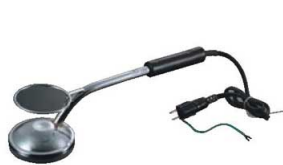
①電気式キャラメライザー 112924