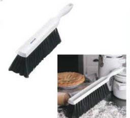
⑳カーライル カウンターブラシ ブラック 40481