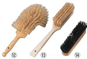
⑫マトファー フランスパンブラシ 79401