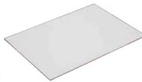
⑦取り板 アルミン ハードタイプ CTL-51100