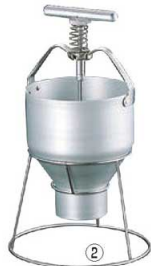
②EBM ドーナツメーカー スタンド