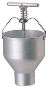
①EBM アルミ ドーナツメーカー