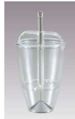
③PC ドーナツメーカー No205