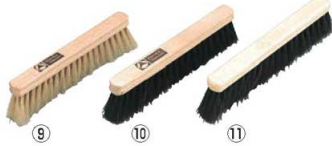
⑨テルモハウザー 木柄 パンブラシ ベージュ 44381