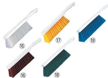
カーライル カウンターブラシ 40480