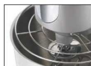
フィンガードがついているので指が巻き込まれにくい構造です。