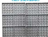
ベルジャンワッフル (正角型6個取)