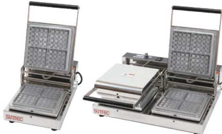
マルチベーカ MAX MAX-1 マルチベーカ MAX MAX-2

外寸:270×455×H195 外寸:540×455×H195 重量:11kg 重量:18kg 電源:単相100V 750W 電源:単相100V 1,500W ●オプションでプレートを増やせば、1台で多彩なメニュー展開が可能に。