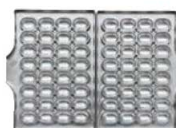
ペーカステラ 32個取