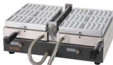
マルチベーカ PRO MSP-100-DX

外寸:485×350(取手含む450)×H190 重量:15kg 電源:単相100V 1,450W ●オプションでプレートを増やせば、1台で多彩なメニュー展開が可能に。