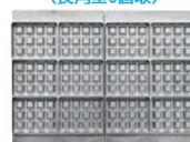
ベルジャンワッフル (長角型6個取)