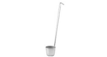
① 18-8 レードル柄 カンロレードル