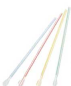
⑰スプーンストロー裸 (500本入)