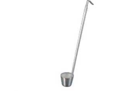
③ 18-8 カンロレードル