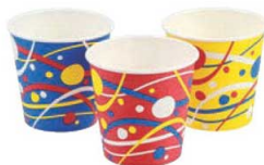
⑩緑日小町カップ (90入) SV-311EN