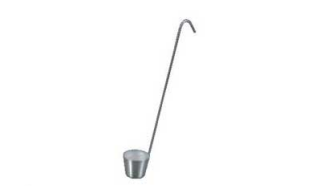
② 18-8 ワイヤ柄 カンロ杓子