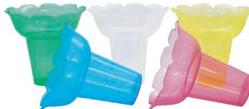
⑪PP フラワー氷カップ 500入 (5色×100)