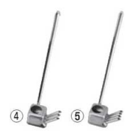
EBM 18-8 ウナギタレカケ