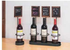
ワインボトルスタンド