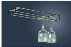
⑤ 18-8 ワイングラスホルダー