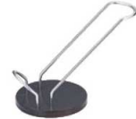
㉓ ワインスタンド アローマ AM-526 ㊦