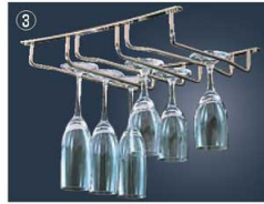
ステムウェアラック

レール内幅:10・16インチ/30mm、20・24インチ/25mm 材質:スチール