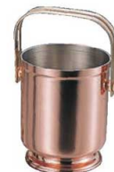
⑯ 銅 リファインド アイスペール S-1804