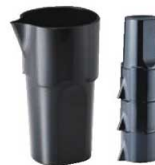
⑨ スタッキング 水差し 10928

166×H240 容量:1.5ℓ 材質:ABS樹脂 耐熱温度:80℃ 付属品:アイストング ●スタッキングを前提とした商品の為、積み重ねた状態でも通気性を確保。内側が密封されず衛生的です。