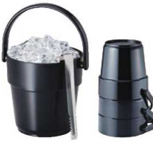
⑧ スタッキング アイスペール 10929