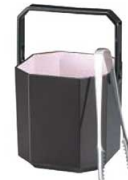
⑩ 角 アイスペール スナック溜

88×102×H170 容量:0.7ℓ 材質:ABS樹脂 耐熱温度:80℃ ●スタッキングを前提とした商品の為、積み重ねた状態でも通気性を確保。内側が密封されず衛生的です。 ●重心も下部の方に近づけて転倒しづらくしております。