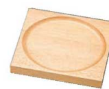
㉖ 木製 アイスペール用トレイ