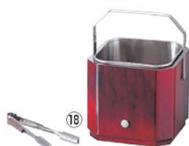
⑱ ニューク アイスペール (トング付)