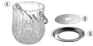
④ UK アクリル アイスペール ハンドル付