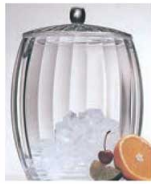
① アクリル二重アイスバスケット AP-98