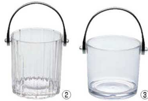
UK アクリル アイスペール