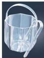
⑦ アクリル アイสบasket クリア (トング付) KY-016