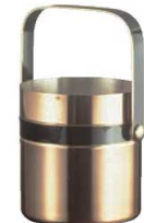
⑰ 銅 バビオア アイスペール B-705