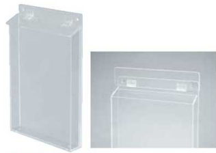
① アクリルパンフレットケース A4