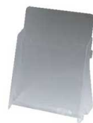
⑦ カタログホルダー A190 (B5判)