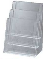
③ カタログホルダー 3C230 (A4判3段)