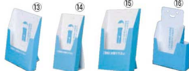
ペーパーリーフスタンド