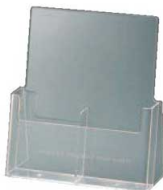
⑨ パンフレットスタンド 2C-112