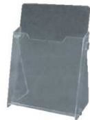
⑥ カタログホルダー A230 (A4判)