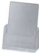
⑤ カタログホルダー C230 (A4判)