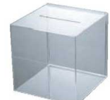
⑭ 応募箱 41434