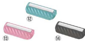
庖丁研ぎホルダー TOGRIP