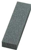
⑥修正砥石 ダイヤブリック #36