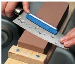
⑪庖丁研ぎホルダー スーパートゲール