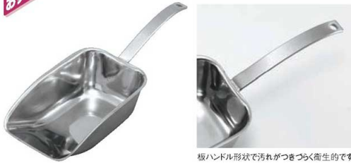
板ハンドル形状で汚れが付きづらく衛生的です。