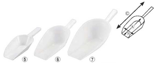
テルモハウザー PP 粉スコップ