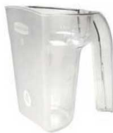
⑳ ラバーメイド セーフティスクープ