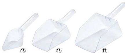
カーライル アイススコップ