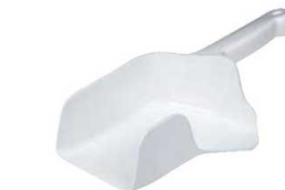
⑱ PP 氷山盛りくんスコップ