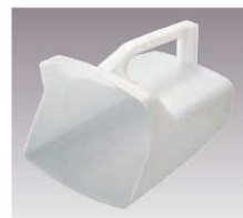
⑳ ラバーメイド 万能スクープ

材質:ポリカーボネイト 耐熱温度:-40~100℃ 安全な取り分け作業と正確な計量が可能 ●スクープが抜かないデザイン(特許申請中)で、取手部分が食材に触れないよう衛生面を考慮 ●カップ、ボウル、シリコン製の表示が付いているので、正確な計量が可能 ●取り分けスクープ、計量カップのダブル機能