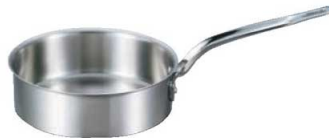
②EBM ビストロ 三層クラッド 浅型 片手鍋 (蓋無)