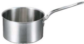
①EBM ビストロ 三層クラッド 深型 片手鍋 (蓋無)

アルミの熱伝導率はステンレスの約13倍。鍋底で受けた熱をす ばやく全体に伝え効率よく加熱するので、時間短縮・コストダウ ンにつながります。 また、熱ムラがなく、IH使用時に底部に見られる「輪状のコゲあ と」も防ぎますので、IHとの相性抜群です。外層は耐久性に優れ たステンレスでガードした理想的な材料です。