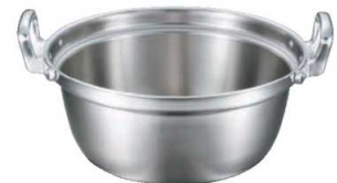
③EBM ビストロ 三層クラッド 料理鍋