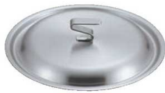
④EBM ビストロ 19cr 銅蓋