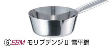
⑥EBM モリブデンII 雪平鍋