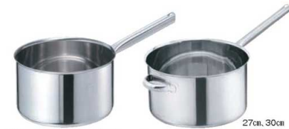
①EBM モリブデンII 深型 片手鍋 蓋無