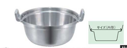
⑤EBM モリブデンII 料理鍋