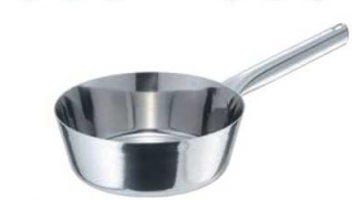
③EBM モリブデンII テーパーパン