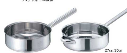
②EBM モリブデンII 浅型 片手鍋 蓋無