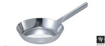
④EBM モリブデンII フライパン