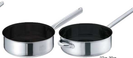
②EBM モリブデンII プラス 浅型 片手鍋 蓋無