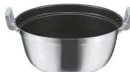
⑤EBM モリブデンII プラス 料理鍋