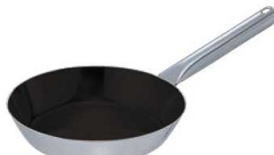
④EBM モリブデンII プラス フライパン