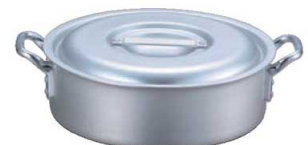
③EBM アルミ プロシェフ IH 外輪鍋