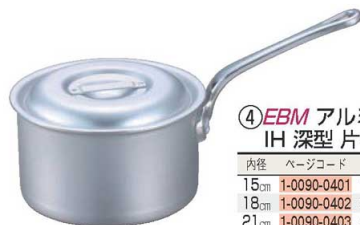
④EBM アルミ プロシェフ IH 深型片手鍋 (目盛付)