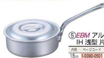
⑤EBM アルミ プロシェフ IH 浅型片手鍋 (目盛付)