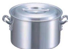
②EBM アルミ プロシェフ IH 半寸胴鍋 (目盛付)