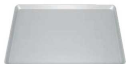
⑪アルマイト加工 ヨーロッパ軽量天板