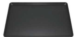
⑧フッ素加工 ヨーロッパ軽量天板