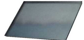
⑭鉄 黒皮 天板