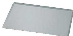
⑫SASA アルミ 天板 (アノダイズ加工仕上)