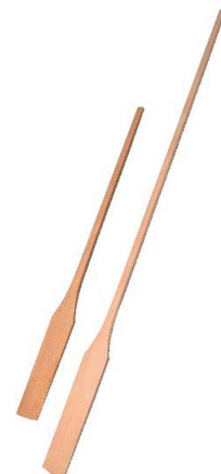
⑦木製テンパンサシ (桧材)