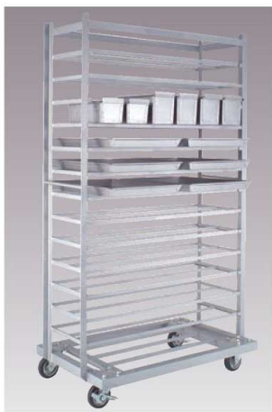
⑤EBM 鉄 トンボラック 26枚差 天板・食パンケース用 別梱包