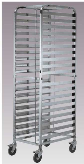
⑥EBM ステンレス ベーカリーカート 別梱包