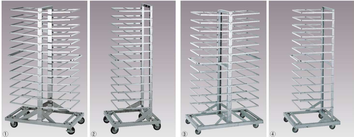
①EBM 18-8 トンボラック 両袖 (26枚差) 別梱包