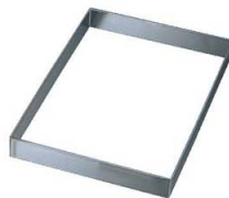
⑤EBM 18-8 角 セルクル 6枚取天板用