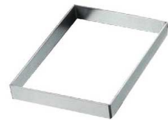
③EBM 18-8 角型 深型 セルクルリング