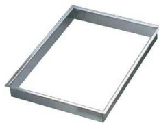
④EBM 18-8 角 セルクル ツバ付 6枚取天板用

※EBM 角セルクルリング37cm、48cmは鉄黒皮製テンパン、アルタイト天板に合う大きさです。 鉄黒皮製テンパン、アルタイト天板はP946をご参照ください。