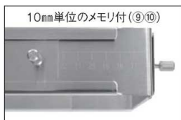
お好みのサイズに拡大縮小できます。