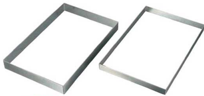
①EBM 18-8 角型 ケーキリング