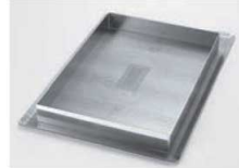
⑥をセットした場合