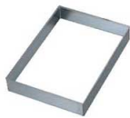
⑥EBM 18-8 角 セルクル 6枚取天板用1/2