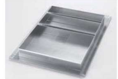
⑦⑧をセットした場合