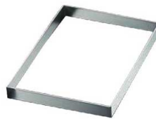
②EBM 18-8 角型 浅型 セルクルリング