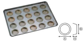
③シリコン加工 ミラソン65型天板 (20ヶ取)