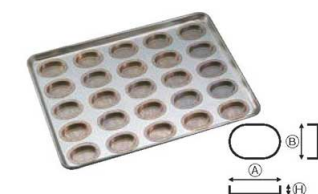
⑨シリコン加工 オーバル型天板 (25ヶ取)