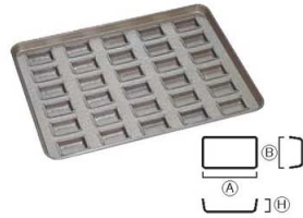
⑫シリコン加工 トロフィー型天板 (30ヶ取)