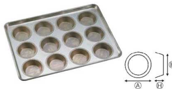
⑤シリコン加工 マルメット型天板 (12ヶ取)