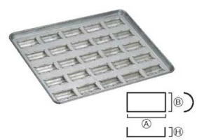
⑬シリコン加工 半円筒型天板 (25ヶ取)