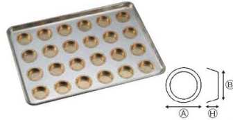
②シリコン加工 カステラカップ型天板 (24ヶ取)