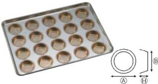
④シリコン加工 ミニマンケ75型天板 (20ヶ取)