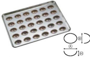
①シリコン加工 アペール型天板 (30ヶ取)