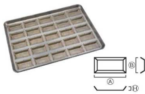
⑩シリコン加工 センチュリー型天板 (25ヶ取)