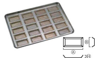
⑦シリコン加工 センチュリー型天板 大 (20ヶ取)