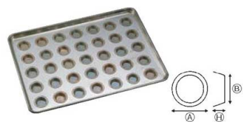
⑥シリコン加工 プティフル型天板 (35ヶ取)