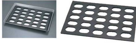
② ゴム製 小判型 ダコワーズ