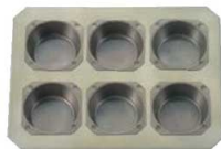
⑧ シリコン加工 プリン型 6連