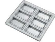
⑥ シリコン加工 フィナンシェ型 天板 (6ヶ取) フラット仕上げ