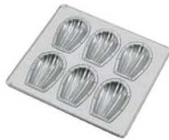
④ シリコン加工 貝型 天板 (6ヶ取) フラット仕上げ