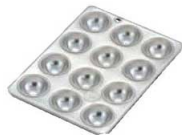
⑩ ブリキ マコロン マフィン型 12カップ