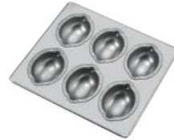
⑤ シリコン加工 レモン型 天板 (6ヶ取) フラット仕上げ