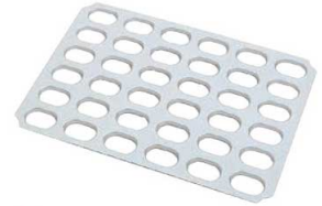
③ マトファー アルミ ダコワーズ 791749