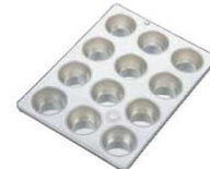
⑨ FK ブリキ マフィン型 #A10カップ 12ヶ付