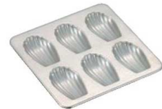
⑥パティシエール 18-8 シェル型 マドレーヌ PP-643