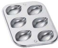
④ギルア マドレーヌ型 レモン型 6P No.918