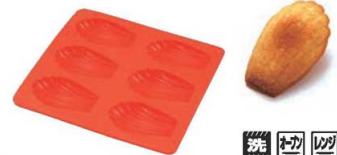
⑨6pcマドレーヌ・シェル型 SIL-53