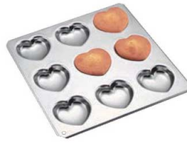
⑤ギルア マドレーヌ型 コックハート型 9P No.994