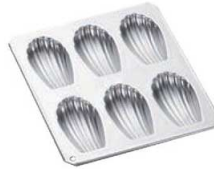
②ギルア マドレーヌ型 マドレーヌシェル型 6P No.987