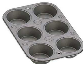
⑧テフロンセレクト マフィンパンケーキ型 6P 57288