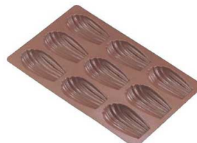
⑫シェル・マドレーヌ型 B-023