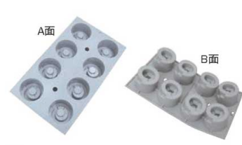
⑩ エラストモールド GEO 階段 1844-01