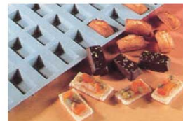
⑦ エラストモールド ミニフィナンシェ