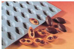
① エラストモールド ミニポート