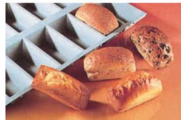
④ エラストモールド ケーキ 大