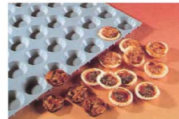
⑤ エラストモールド ミニタルト