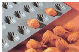
⑥ エラストモールド ミニマドレーヌ