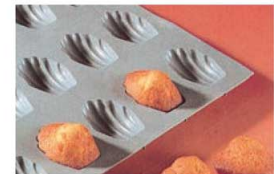
③ エラストモールド マドレーヌ 大