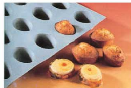
② エラストモールド 小判型