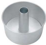
④アルミ シフォンケーキ型 底取