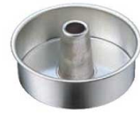
⑨FK プリキ 管付 デコレーション型 共底 18cm