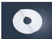
⑫シフォンケーキ型用 敷紙