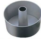
③SV シフォンケーキ型