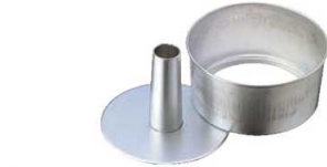
⑥アルスター シフォンケーキ型 底取