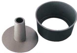
①ブラックフィギュア シフォンケーキ焼型