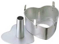
⑦アルスター ハート シフォンケーキ型 底取