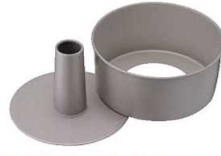
②フッ素樹脂 シフォンケーキ型