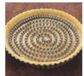
⑬ボールチェーンのパイ生地重し DL-6392