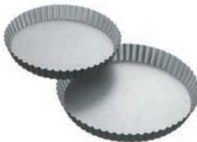
⑤ブラックフィギュア タルト型