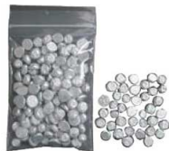
⑪アルミ 普及型 タルトストーン