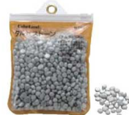
⑫アルミ タルトストーン No.1102