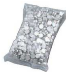
⑩EBM アルミ タルトストーン