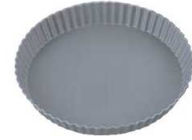
③アルブリット タルト型 共底