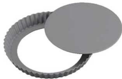
④ブラックフィギュア タルト型 底取