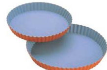
⑥トッピングオレンジ タルト型