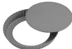
⑧フッ素樹脂加工 タルトケーキ型 底取

材質:スチール 表面加工:内側/フッ素樹脂加工 外側/耐熱塗装(耐熱温度250℃)