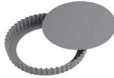
②アルブリット セバトタルト型 底取