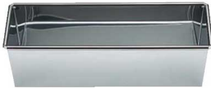
④18-0 パウンドケーキ型