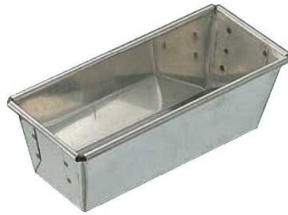
①マトファー パウンド型