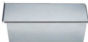
⑦18-0 パウンドケーキ型 蓋付