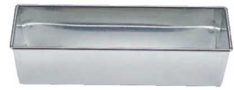
⑥ブリキ パウンドケーキ型