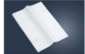
③ニューパウンド 細型用 敷紙 (30枚入)