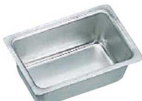
⑨TP 総絞り ミニ パウンドケーキ型 大 (1個入) No.2342