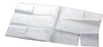
⑪パウンド型用敷紙