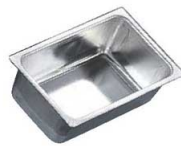
⑩TP 総絞り ミニ パウンドケーキ型 小 (1個入) No.2343