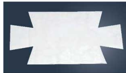
⑤パウンドケーキ用 敷紙 (30枚入)