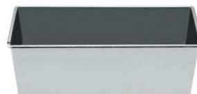
⑧18-0 パウンドケーキ型 蓋無