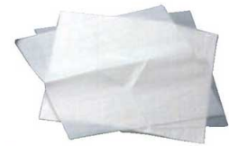
⑯カップケーキ用 敷紙 (30枚入) ㊦