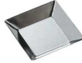
②ギルア タルト型 無地 正方形 ㊦

内寸:φ73(φ53)×H11 材質:スチール・クロムメッキ ●タルトレット型に合わせて、パイが切りやすいように型の縁が刃状になっているので、生地を型に入れ、縁を指で押すだけできれいに生地がきれえます。