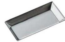
③ギルア タルト型 無地 長方形 ㊦

内寸:68(45)×68(45)×H12 材質:スチール・クロムメッキ ●タルトレット型に合わせて、パイが切りやすいように型の縁が刃状になっているので、生地を型に入れ、縁を指で押すだけできれいに生地がきれえます。