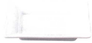
T123-80-20 15cm長形灰皿(白) 14.8×12×H2.8cm ¥920 CHN (6/36)