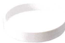
T123-80-40 (在)11cmホテル深トレー 11.3×2.8cm ¥150 JPN