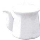
T123-20-115 白八角醤油<S> 5.5×7.5×6.5cm・60cc ¥450 CHN (24入)