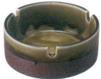
T123-80-39 ビード口灰皿 10×4.3cm ¥700 JPN