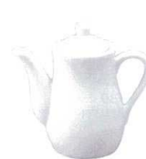
T123-21-20 (在)N醤油(小) φ6.5×H9cm・100cc ¥270 CHN