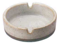
T123-80-35 (在)粉引丸灰皿(スタック) 10.3×3.8cm ¥350 CHN