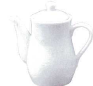
T123-21-18 (在)N醤油(大) φ6.7×H10.5cm・200cc ¥330 CHN