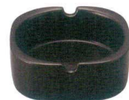
T123-80-16 角灰皿<L>BK 9.2×9.2×H4cm ¥500 CHN