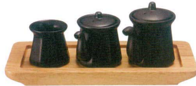
T123-20-114 (在)黒八角楊子 φ4.5×H4.5cm ¥160 CHN (24入) T123-20-116 (在)黒八角醤油<S> 5.5×7.5×6.5cm・60cc ¥300 CHN (12入)