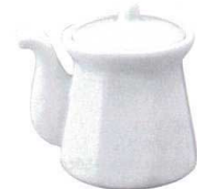
T123-20-117L 白八角醤油<L> 7×9×9cm・150cc ¥800 CHN (6入)