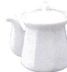
T123-20-117M 白八角醤油<M> 6×8×7.5cm・80cc ¥570 CHN (12入)