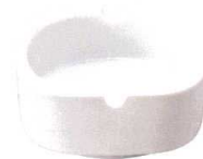
T123-80-15 (在)角灰皿<L>WH 9.2×9.2×H4cm ¥200 CHN