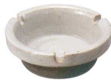
T123-80-37 (在)粉引高台丸灰皿 11.5×4cm ¥400 CHN