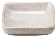
T123-80-33 (在)粉引角灰皿(スタック) 10.2×10.2×2.8cm ¥200 CHN