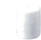
T123-20-111 白ストレート塩 φ4×H5.5cm ¥220 CHN (24入)