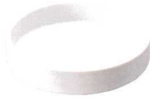
T123-80-41 (在)11cmホテルスタック浅トレー 11.3×2.3cm ¥200 JPN (26入)