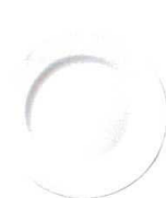
T137-8577-12 17cmリムプレート ファリナ φ16.8×H2.1cm・内径11.5cm ¥800