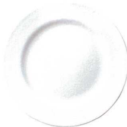
T137-8577-03 27.5cmリムプレート ファリナ φ27.3×H2.6cm・内径17.3cm ¥2,700