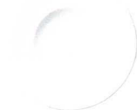
T137-8515-10 C2 21cmプレート (白) φ21.0×H2.5cm・内径11.4cm ¥1,050