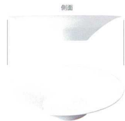
T137-8577-11 26cmパスタファリナ φ25.8×H5.7cm ¥3,600