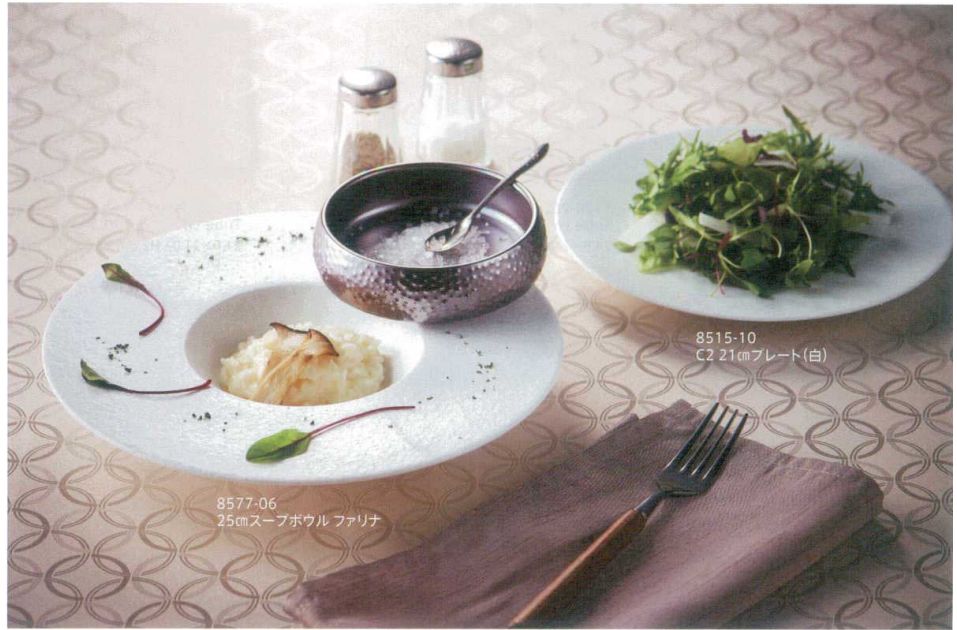
8577-06 25cmスープボウル ファリナ