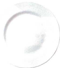
T137-8577-02 25cmリムプレート ファリナ φ24.7×H2.2cm・内径15.7cm ¥1,800