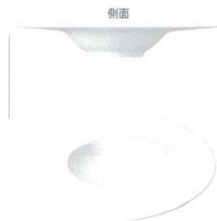
T137-8577-06 25cmスープボウル ファリナ φ25.1×H4.0cm・内径11.3cm ¥3,300