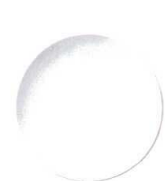
T137-8577-13 16.5cmメタプレート ファリナ φ16.5×H1.9cm ¥800