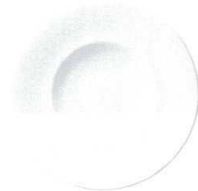
T137-8577-10 C2 21cmプレート ファリナ φ21.0×H2.5cm・内径11.4cm ¥1,400