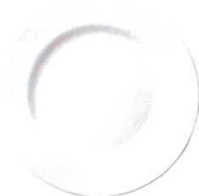
T137-8577-01 20cmリムプレート ファリナ φ19.8×H2.0cm・内径12.5cm ¥1,400