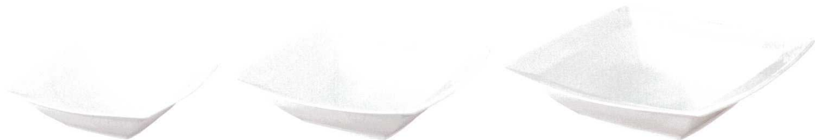
T147-CR09 16スーププレート 16×16×H4.5cm ¥1,170(6/72)