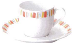
T182-031-24 コーヒーカップ φ10.2×7.6×H6.5cm・190cc ¥1,070 T182-031-23 コーヒーソーサー φ15.3×H1.9cm ¥800