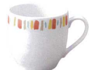
T182-031-19 マグカップ 10.9×8×H7.8cm・260cc ¥1,200