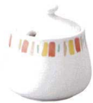
T182-031-17 シュガー φ7.9×H8.4cm・180cc ¥3,030