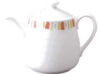
T182-031-15 ポット(大) 19.2×10.9×H15cm・700cc ¥5,280