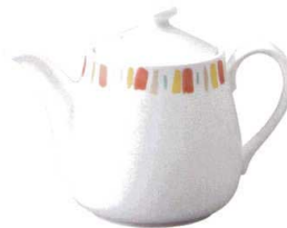
T182-031-16 ポット(小) 14.5×9.6×H11.8cm・440cc ¥4,290