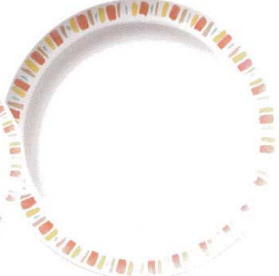
T182-031-03 7 1/2"ミート φ19.8×H2.4cm ¥1,210