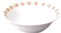
T182-031-08 オートミル φ16.5×H4.8cm ¥1,210