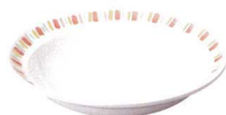
T182-031-07 7 1/2"スープ φ20×H3.7cm ¥1,320