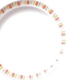
T182-031-02 9"ミート φ23.8×H2.4cm ¥1,600 T182-031-01 10"ミート (OR) φ26.1×H3.1cm ¥2,200