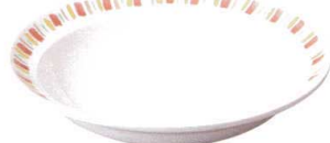
T182-031-06 9"スープ φ23.5×H4.1cm ¥1,650