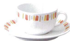
T182-031-22 紅茶カップ φ11.3×8.9×H5.5cm・200cc ¥1,080 T182-031-21 紅茶ソーサー φ15.3×H1.9cm ¥800