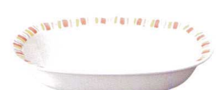
T182-031-14 ペーカー 25.3×17×H5.1cm ¥4,400