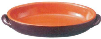
T213-100-25 BR 23cmオーバル 23.2×14.2×H4.1cm・550cc ¥3,900 ITL ★木台=T223-10-54