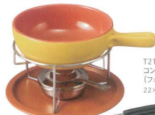
T213-9905-0529 コンロ台 (フォーク4本付、アルコール燃料対応) 22×H10.5cm ¥4,700