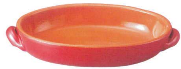
T213-100-66 RD 23cmオーバル 23.2×14.2×H4.1cm・550cc ¥4,320 ITL ★木台=T223-10-54