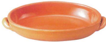
T213-100-82 LT 23cmオーバル 23.2×14.2×H4.1cm・550cc ¥3,900 ITL ★木台=T223-10-54