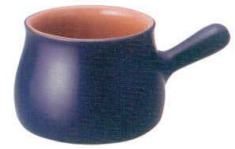
T213-2751-07/B (在)チーズフォンデュ鍋(BL) 13.5×19.5×9.5cm・800cc ¥1,000 ★木台=T223-10-47