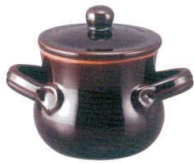
T213-100-13 BR蓋付スープ鍋 9×11cm・280cc ¥2,300