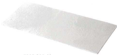
T299-311-41 wasabi WH 33.5cm長角皿 33.5×16.5×H0.8cm ¥7,400