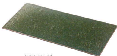
T299-311-44 wasabi (オリベ) 33.5cm長角皿 33.5×16.5×H0.8cm ¥7,800