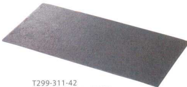
T299-311-42 wasabi BK 33.5cm長角皿 33.5×16.5×H0.8cm ¥7,400