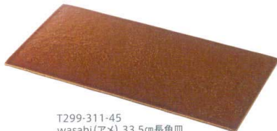
T299-311-45 wasabi (アメ) 33.5cm長角皿 33.5×16.5×H0.8cm ¥7,800