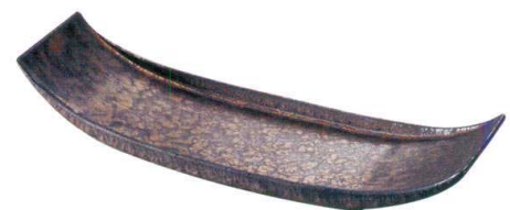
T306-290-3401 金結晶舟型32cm皿 30×10.4×H5.7cm ¥2,880 611230134