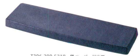
T306-290-5219 鉄ペーバー付出皿 30×9.5×H2cm ¥2,600 511320152