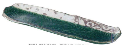
T306-290-3570 織部山里 桐目長皿 33.5×10×2cm ¥1,350 611350135