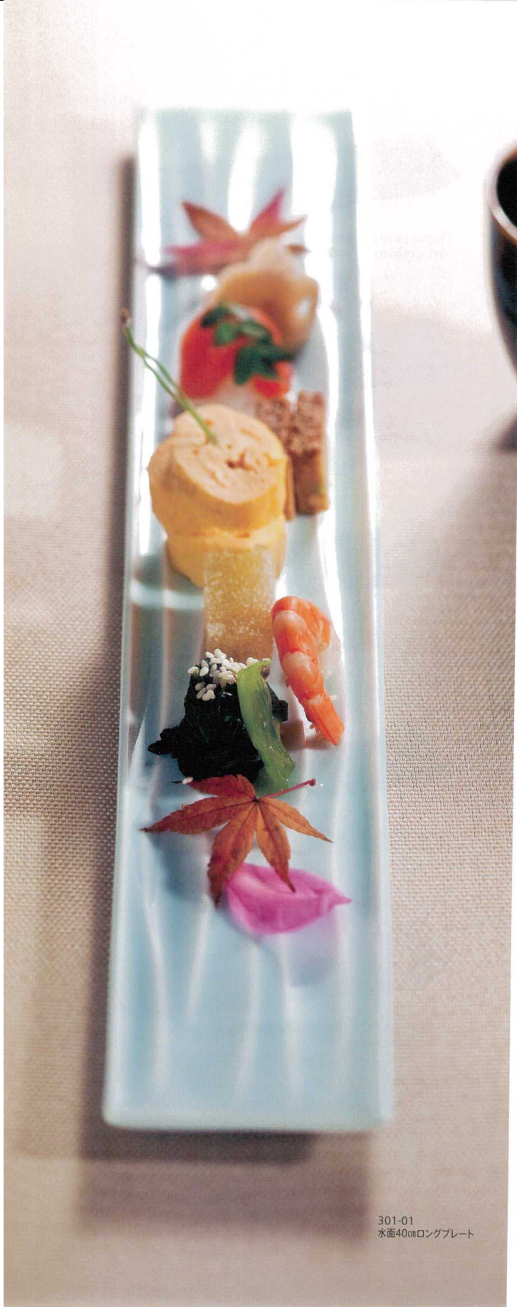
301-01 水面40cmロングプレート