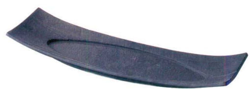
T306-26-09 料亭削(BK)尺一長角皿 35.7×10.2×H3.6cm ¥2,100