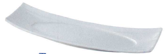
強化 T306-27-09 料亭削(WH)尺一長角皿 35.7×10.2×3.6 ¥2,100